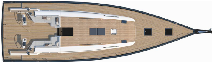
Versión 3 camarotes 2 cuartos de aseo: