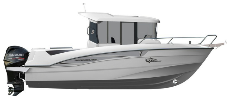
Versión 3 puertas: